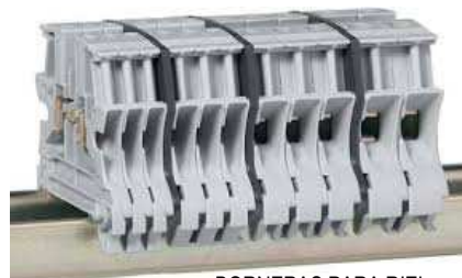
BORNERAS PARA RIEL